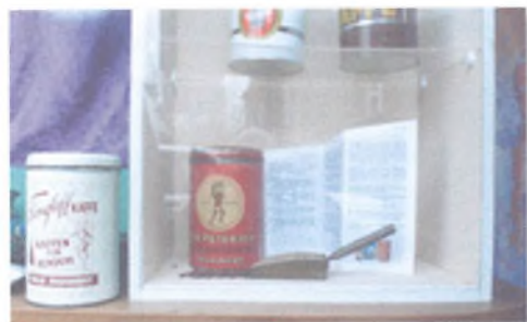
Billedkvaliteten skyldes foto er taget gennem butiksrude og montre

Hele ideen har været at få bysbørnenen ud i byen og opleve byen på en anderledes og spændende måde.