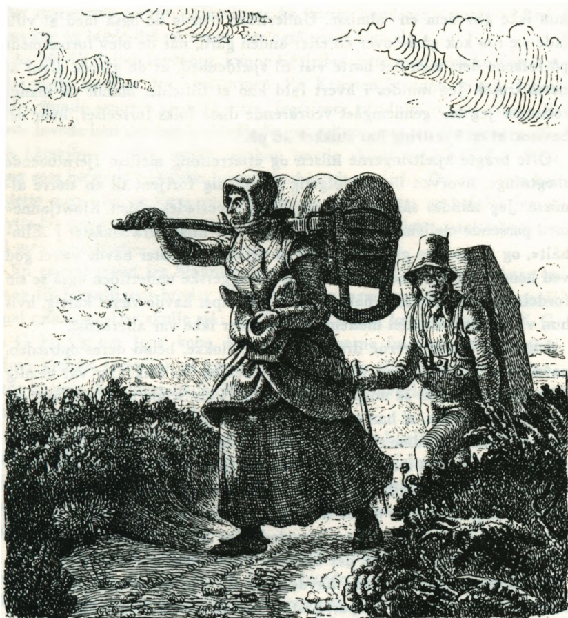
Natmandsfolk på vandring. (C. Dalsgård, 1855).

såvel de to kvinder som de øvrige af, det bedste de kunne. Det var dog ikke altid, Kjæltringerne lod sig så let forskrække; men så hændte det da også, hvad følgende træk viser, at de kunne blive narrede. Sam-