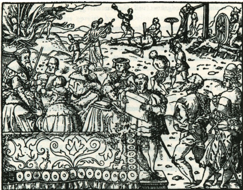
Beddel og rakker i virksomhed. (Tysk træsnit ca. 1550).

Til natmandens bestillinger hørte også at hjælpe til ved grove forbryderes henrettelse og begravelse. Det hedder således i forordningen af 16. oktober 1697: »Hvo, som herefter befindes og lovlig overbevises med frie Forsæt og beraad Hue at have myrdet sin Ægtefælle, sin Herre eller Husbond, sin Frue eller Madmoder eller nogen af deres Børn, skal uden al Naade saaledes straffes, at han af Skarpretteren knibes med gloende Tænger, først udenfor det Huus eller Sted, hvor Mordet er begaaet, siden, om det er i en Kiøbsted, paa alle Byens Torve eller offentlige Steder, og om det er paa Landet, da 3 Gange mellem Giernings- og Retterstedet, og allersidst paa Retterstedet; dernæst skal den Skyldiges høire Haand levende afhugges med en Øxe, hvorpaa Legemet af Natmandens Folk skal lægges paa Steile og Hovedet tilligemed Haanden fæstes paa en Stage oven over Legemet. «