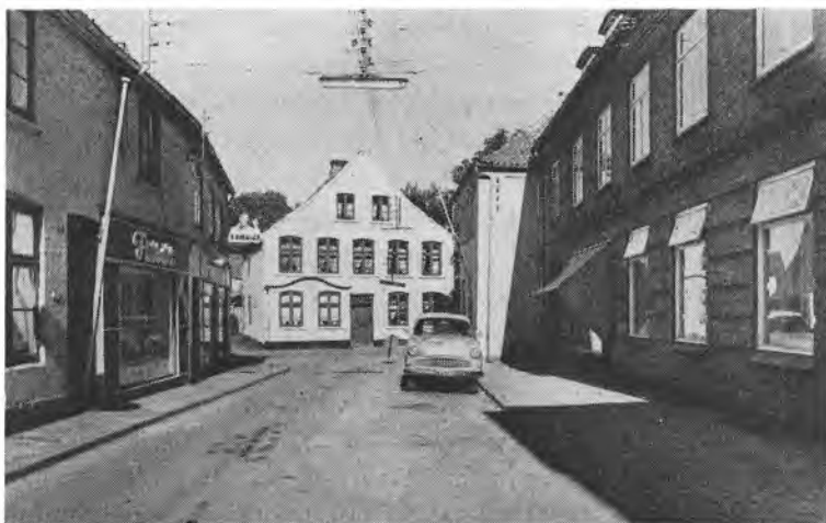
Vestergade med Nybro 2.

I umiddelbar nærhed af den plads, hvor ejendommen Nybro 2 lå, må