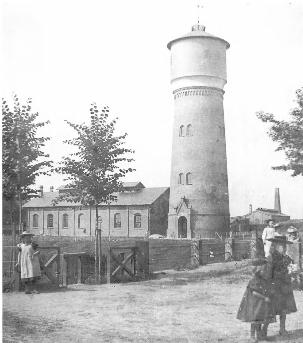
Vandtårnet i Tønder med pumpehuset indviet i 1903 var ny, da Peter Fangel tog dette billede.

leder af det gamle land. Her fremmede det formentlig genkendelsen og erindringerne at se stederne med det liv, der hører med. Det er muligvis også en del af forklaringen på, at mange af billederne