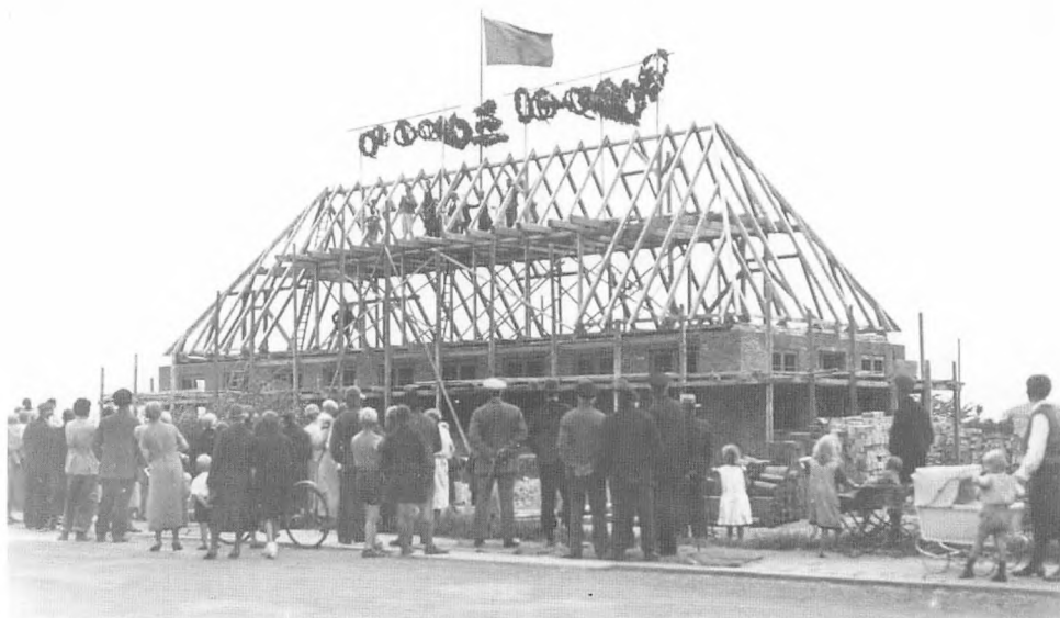
Rejsegilde for den danske skole i Tønning den 20. oktober 1935.