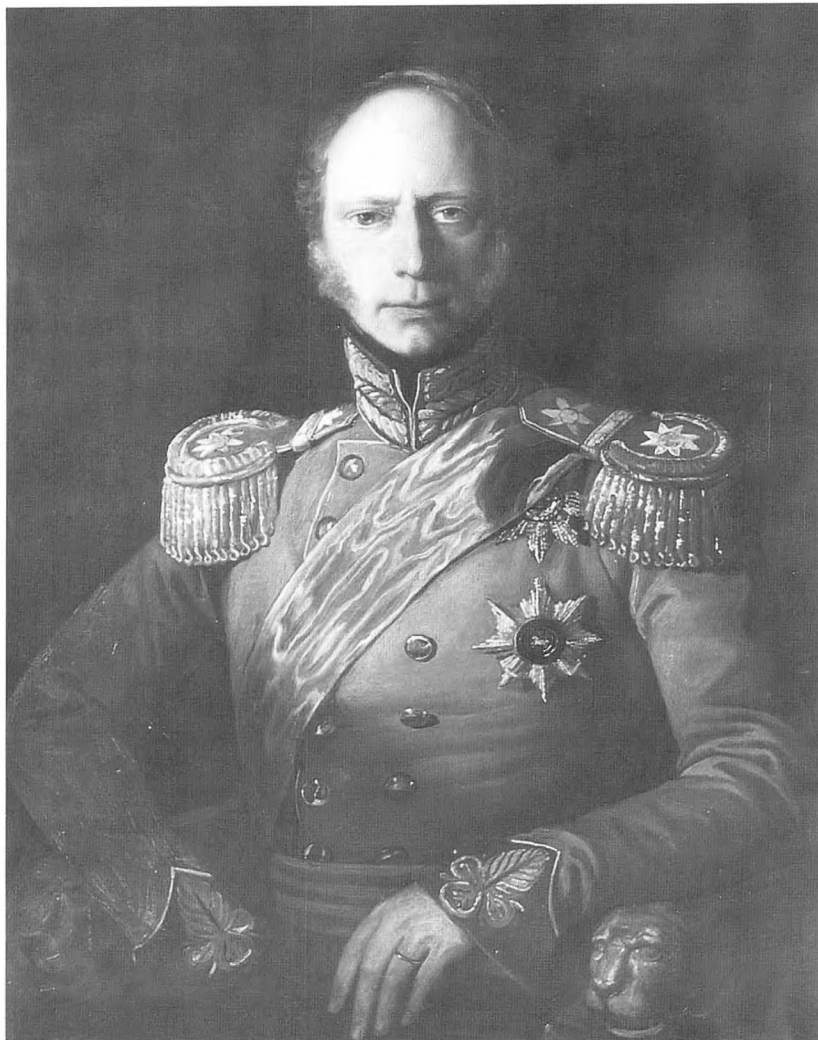
Hertug Christian Carl Frede- rik August (1798-1869) malet 1845.

sagde ja til at tage med prinsen og hans hustru, prinsesse Caroline Amalie, på besøg hos hendes bror og svigerinde på Augustenborg Slot, hertug Christian August II og hertuginde Louise Sophie, der var en datter af greve Danneskiold-Samsøe på Gisselfelt. Også prinsessens mor, den gamle enkehertuginde Louise Augusta, boede på Augustenborg.