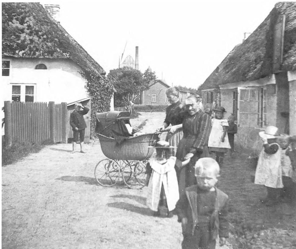
Der er næppe tvivl om, at personerne på Peter Fangel's billeder er stillet op, men de udvikler sig sjældent til ren staffage, der kun er med for at give billederne dybde. Her er det to mødre med deres børn i Skærbæk.

ne. Ved at befolke billederne med mennesker og vælge motiver fra dagliglivet opnår Fangel en samhørighed mellem beskueren og billedet. Derfor optræder der også motiver og elementer, som ikke nødvendigvis er kønne i traditionel forstand: Banegade med kloakudløb i Rendsborg og en tømmerplads i Vojens.