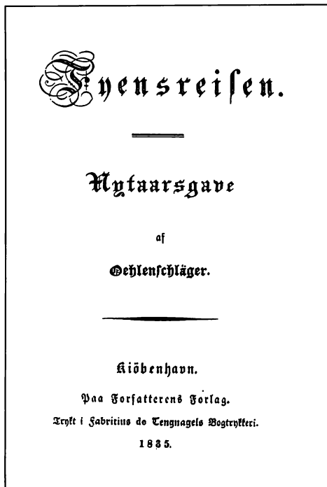
Forsiden af »Fyensreisen« trykt 1835.

Digtsamlingen er optaget i sin helhed i »Oehlenschlägers poetiske Skrifter«, 1861, og ikke senere genoptrykt samlet.