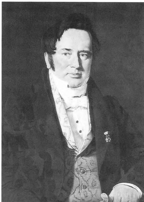
Adam Oehlenschläger malet i 1836 af C.A. Jensen, Frederiksborg.

Altså rejste Oehlenschläger til Fyn, og den 6. juni ankom han til slottet i Odense, hvor han blev godt og hjerteligt modtaget. Prinsens sekretær havde skrevet til ham, at man forventede, han ville deltage i en rejse til Langeland nogle dage senere, og det havde han intet imod. »Rygtet går, at Oehlenschläger er i prinsens følge«, skrev sekretæren, og det var naturligvis smigrende for digteren således at høre, at han næsten var mere betydningsfuld end prinsen selv. I dagene 11.-14. juni besøgte de øen,