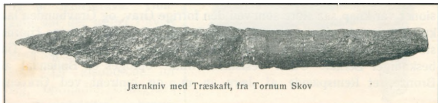
Jærnkniiv med Træskafft, fra Tornum Skov