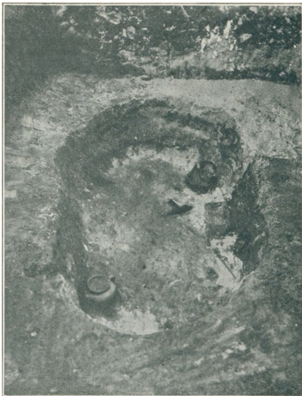
Skeletgrav fra Tornum Skov. Set fra ØSØ.

Den fuldt afdækkede Hustomt var aflangt firsidet, med Længderetning Ø.—V., og stod skarpt afgrænset for nordre Langside og vestre Ende ved her forefundne, ret tætliggende Stolpehuller fra Husets Vægge. Mod Ø. og S. var Stolpehullerne dog vanskeligere at følge, mulig paa Grund af stedfunden Ombygning. Husets Længde var ca. 15\frac{1}{2} m, Bredden ca. 7 m. Ved en Tværvæg i N.—S. har Huset været delt i