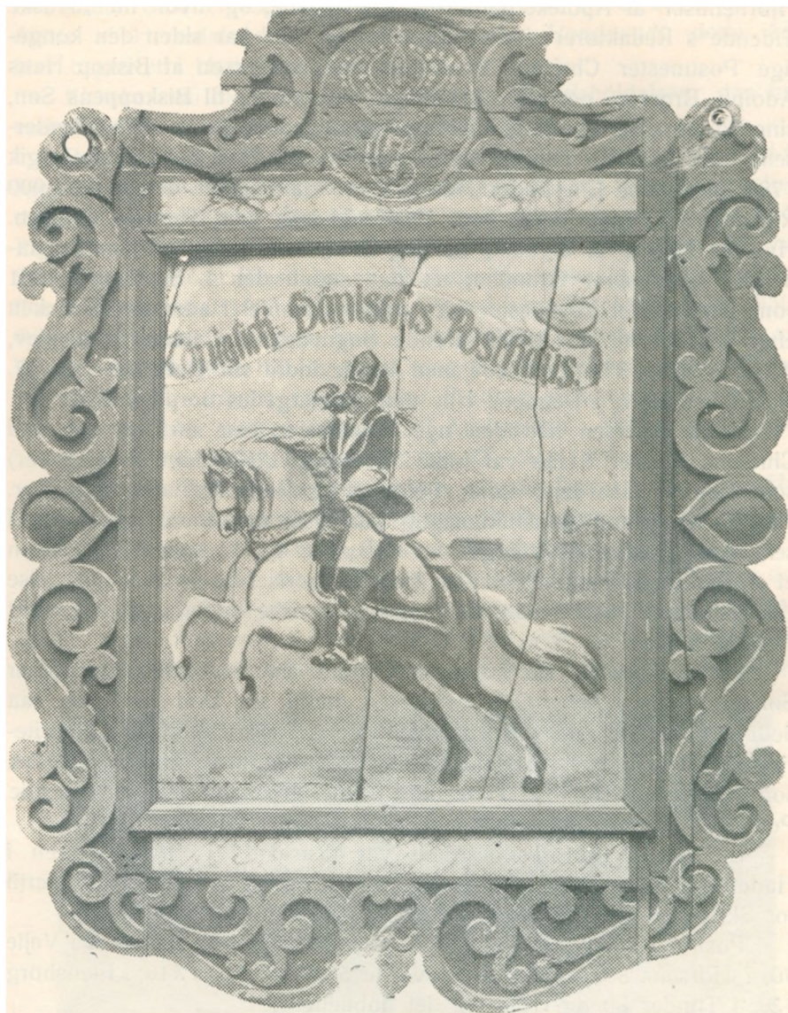
Haderslev gamle Postskilt fra Christian VII.s Tid. Originalen findes paa Rigspostmuseet i Berlin.

7. Marts 1788, indeholder ogsaa den Bestemmelse, at efter hans Død skal Enken og en af Børnene beholde Embedet. Denne Bestemmelse — underligt nok i vore Øjne — fik senere hen Betydning for Familien.