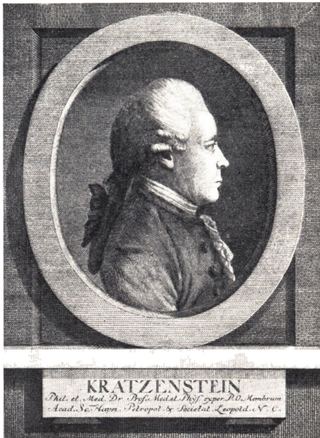
Christian Gottlieb Kratzenstein.

og virker overalt i legemet fordelende, saa at denne kurmetode næsten gør tjeneste som en panacé. Man bliver træt og søvrig derefter som efter udførelsen af et stort arbejde, og elektrifikationen er saaledes tillige et narkotisk middel. Kurmetoden virker endvidere paa lamheder, idet ogsaa ner-