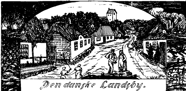
Den danske Landsby.