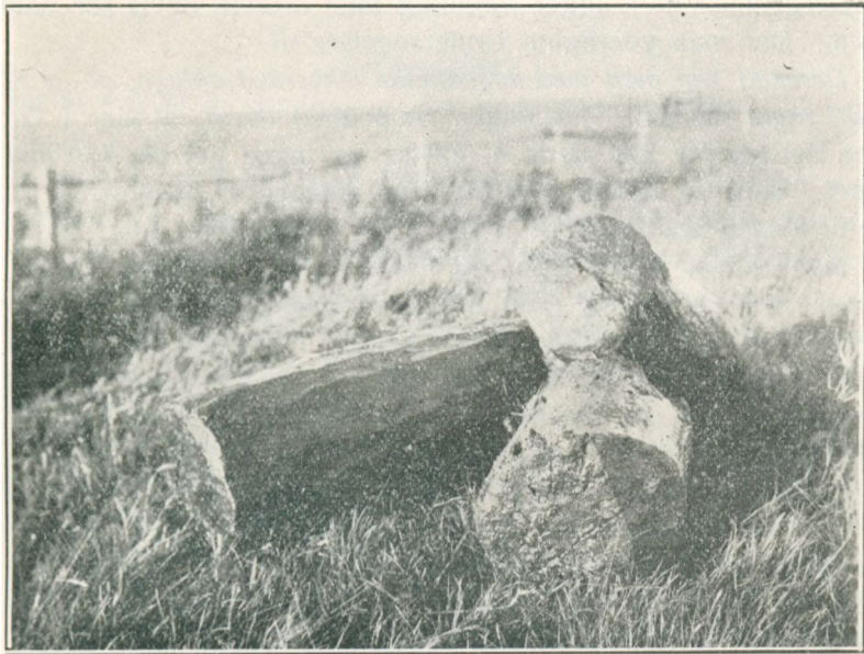
Tre Palisadepæle fra Bredmose.

vendig maa være om ikke jævn gamle med Vejene, saa dog ældgamle. De maa stamme fra den Tid, da Jyder og Angler endnu dannede selvstændige politiske Magter indenfor Sønderjyllands Omraade, da Tjodsamfundene endnu var den højeste Form for politisk Organisation, man kendte til, og da der endnu skulde løbe flere Aarhundreders Vand i Stranden, før et dansk Rige blev skabt. Man kan ikke undtagen i særlig heldige Tilfælde og ved Hjælp af gunstige Fund datere saadanne forhistoriske Virker. Det er derfor ganske umuligt at sige, naar