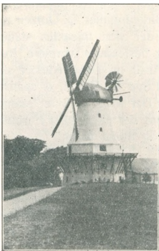
„Trende Gange Dybbøl Mølle skudt i Grus“.

Den ældste Vejrmølle i Belgien ligger i Silly i Hainaut ved Vejen fra Soignies til Ghislenghien, den er måske endda den ældste i Europa, bygget for over 750 År siden, da Korsfarerne vendte hjem fra Palæstina.