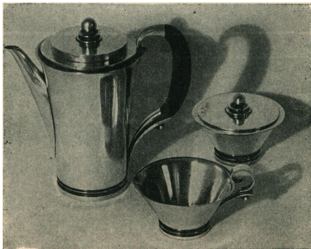
Kaffeservice tegnet af Harald Nielsen, svarende til Pyramide-Mønstreet.