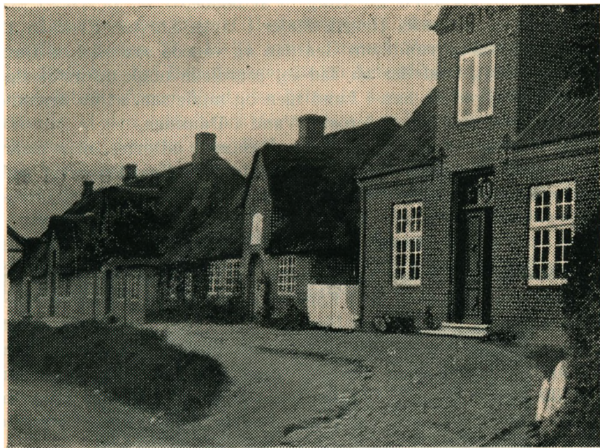
»Vesterraden« i Møgeltønder.

En Sommeraften 1830 sad i et Hus paa Vesterraden en af de omvandrende Nordmænd og underholdt sig med et ungt Kæreste-